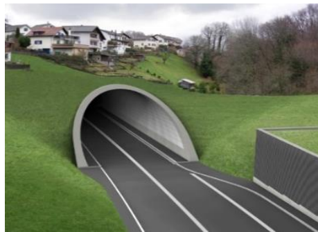
Kantonsstrassen- tunnel 18