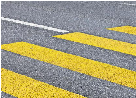
Fussgänger- streifen 1'600