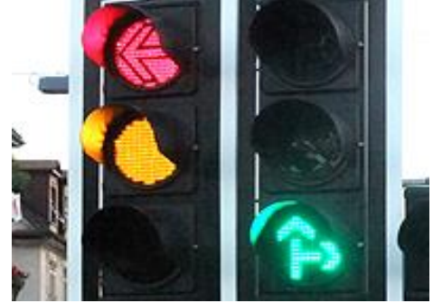
Lichtsignal- anlagen 200